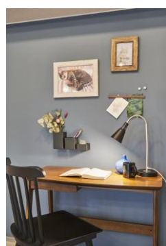
デスク周りの小物類も壁面収納で見た目もすっきり