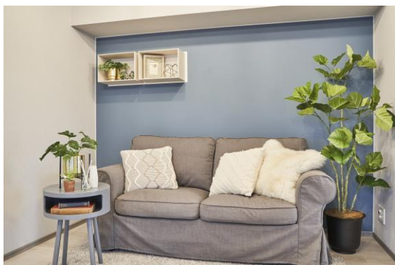
奥のブルーの壁面がマグネット対応壁・左上の箱が強力マグネットbox

リビングやダイニング、洋室などにマグネットが付く壁を設置しました。各住戸に備え付けの強力マグネットbox(耐荷重10kg)を用いて壁面空間をアレンジしたり、マグネット付きの棚やフックを設置すれば釘や画鋲を使わずに写真や小物などを飾ることができます。※設置場所はプランにより異なります。(マグネット対応壁は2タイプのカラースキーム)