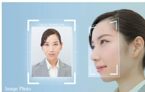
顔認証システム（イメージ）