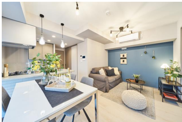
モデルルーム写真（Aタイプ・2LDK+S）