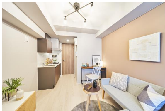
右のピンクの壁面がマグネット対応壁