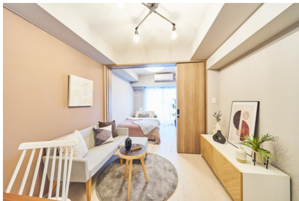
モデルルーム写真（B2タイプ・1DK）