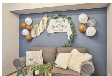
パーティ時はフォトジェニックな空間に