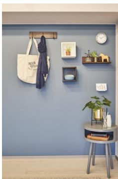
棚やフックを付ければ便利でおしゃれなインテリアに