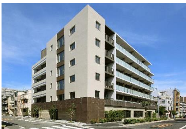
「クレヴィアリグゼ西巢鴨」外観

※裏アカとは、SNSにおいて使われる用語の一つで、メインとなる表のアカウントと対比させて用いる表現“裏のアカウント”の略。「表に出していない秘密のアカウント」という意味で用いられる用語です。